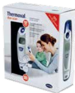
Thermoval® duo scan